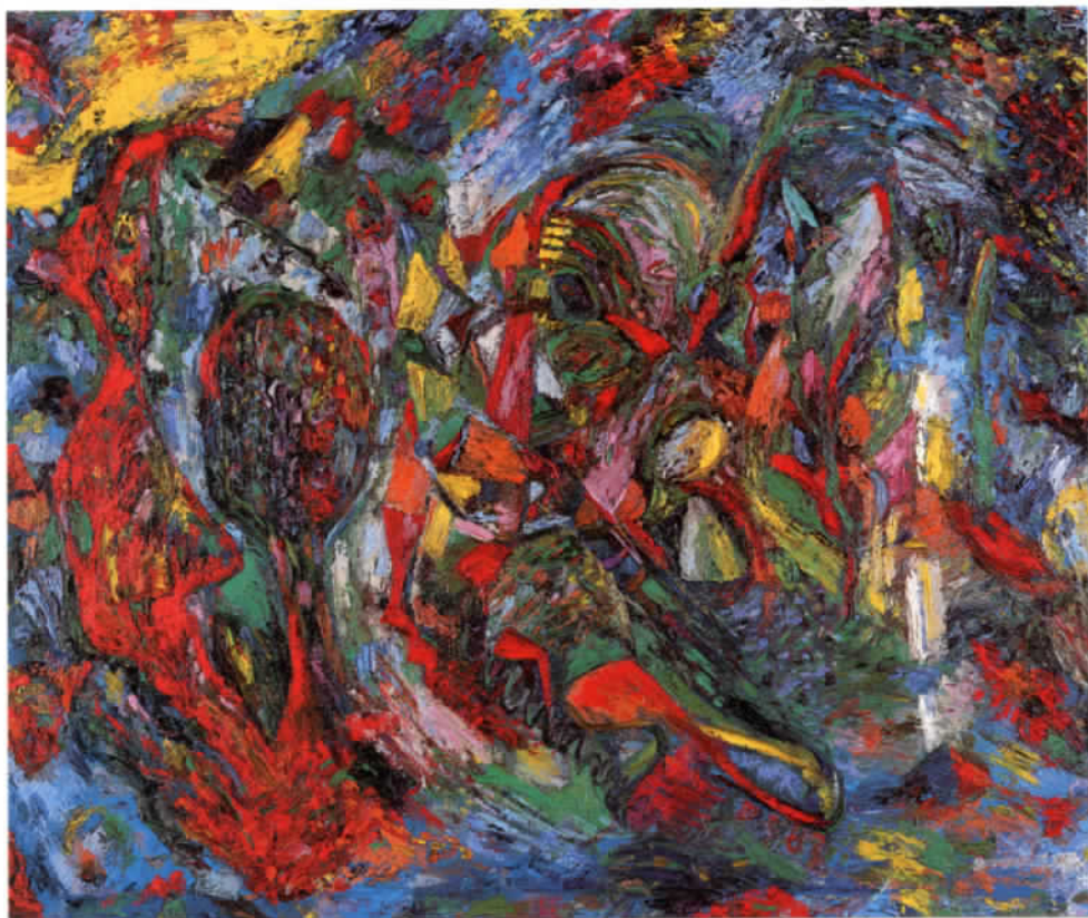
Ohne Titel. 1983. Öl auf Leinwand. 105 x 125 cm.